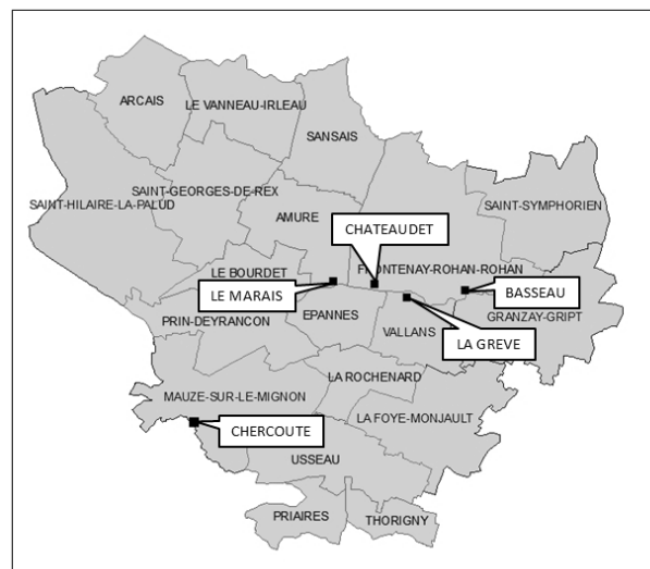
Figure 2 : Ressources du service d'eau de la Vallée de la Courance

Quatre captages sont sur la Vallée de la Courance (Basseau, La Grève, Châteaudet et Le Marais) et un sur la vallée de Mignon (Chercoute).