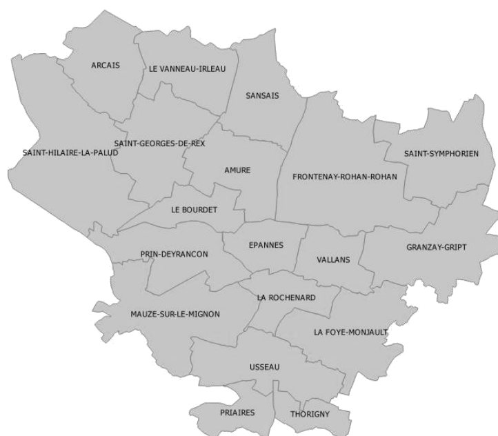
Figure 1 : Communes alimentées par le Service d'eau de la Vallée de la Courance (2021)